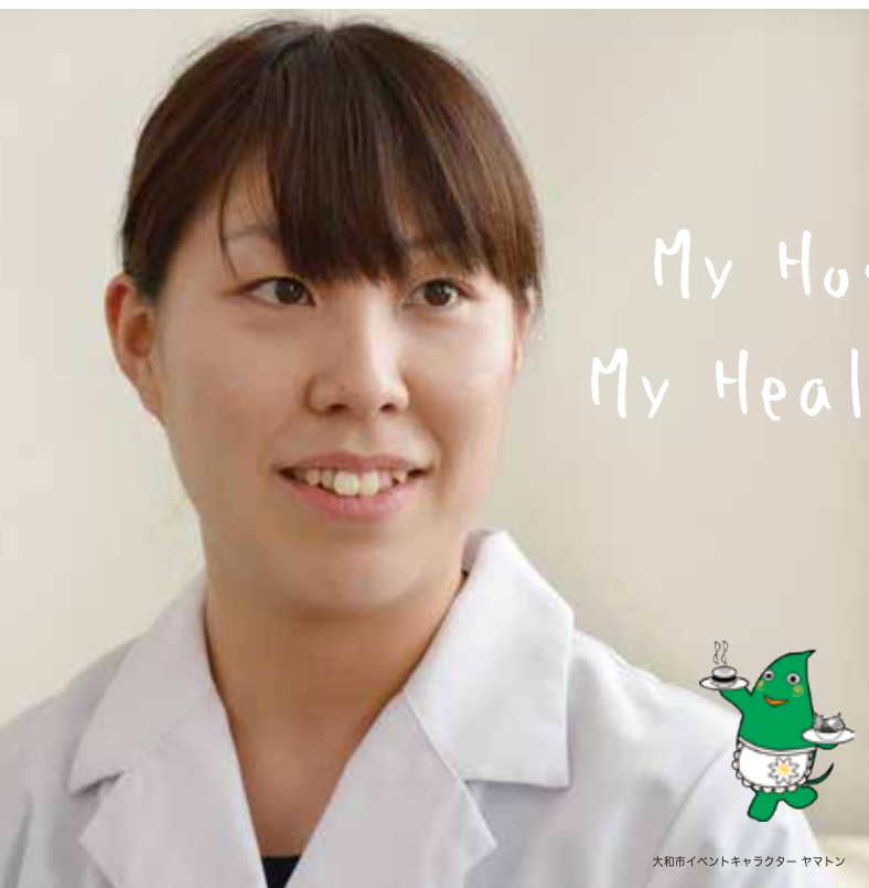
大和市イベントキャラクター ヤマトン