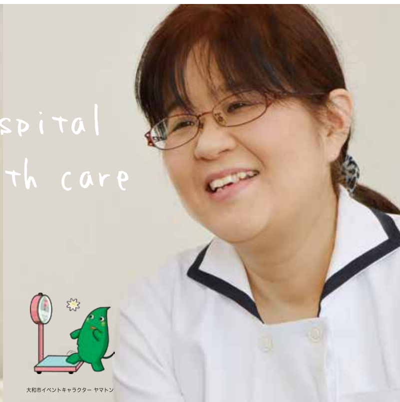
大和市イベントキャラクター ヤマトン